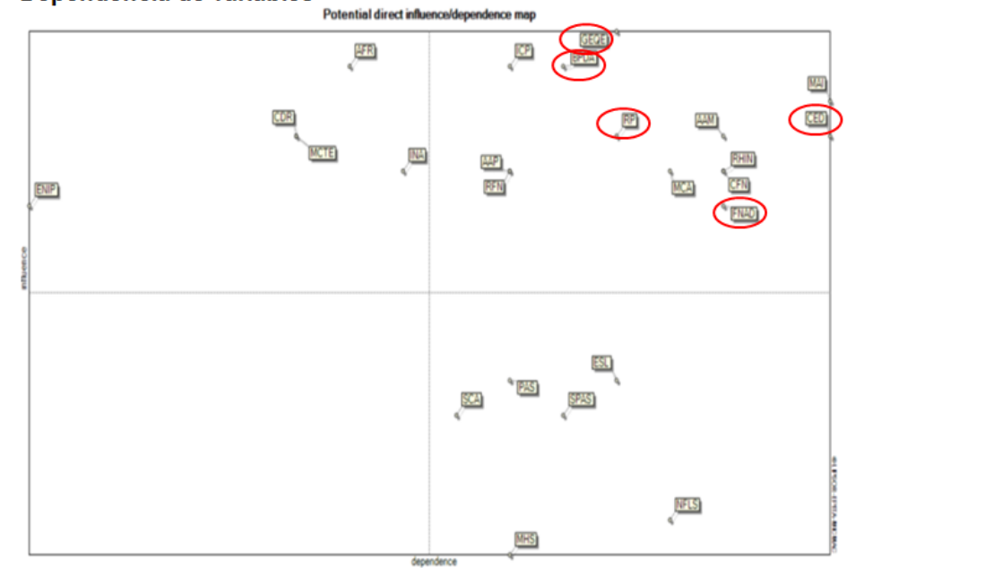
Figura 2. Influencia a partir de las Matrices de Relaciones e Índices de Motricidad y Dependencia de variables

Por último, en las variables autónomas las cuales poseen una baja dependencia y una baja influencia o motricidad del sistema y en el caso de esta investigación no se encuentra ubicada ninguna en ese cuadrante.